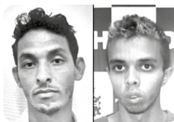
Entorpecentes de Vitória da Conquista, pelos números (77) 98817- 1481 (Wathsapp) / (77) 3425 - 8341.

nesto Município. A Polícia Civil já representou pela prisão preventiva dos referidos traficantes em vários inquéritos policiais instaurados na DTE e qualquer informação sobre o paradeiro dos criminosos poderá ser efetuada através do disque denúncia da Delegacia especializada de Tóxicos e